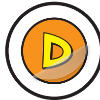
Kein Farbabrieb, da mit Polycarbonat-Schutzlaminat ausgerüstet