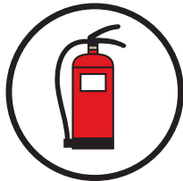
Schwer entflammbar nach DIN EN 15501-1