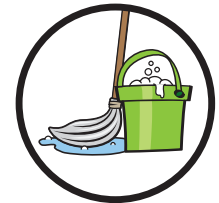
Keine besondere Pflege erforderlich