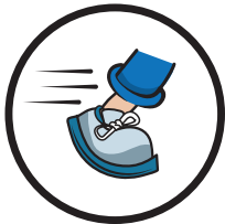
Rutschfest nach DIN 51130 Klasse R9