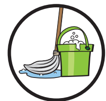
Keine besondere Pflege erforderlich