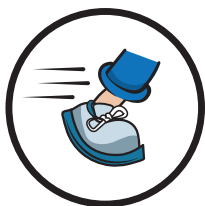
Rutschfest nach DIN 51130 Klasse R9

Unsere Bodenkleber lassen sich mit allen handelsüblichen Reinigern reinigen. Die Nutzung von Reinigungsmaschinen sollten die Aufkleber bei einer vorschriftsmäßigen Aufbringung und dem vollständigen Anziehen problemlos aushalten.