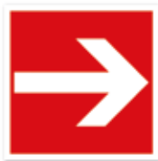
Richtungspfeil rechts, links, hoch, runter