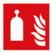
Fernauslöseschalter Auslösestation für Raumschutz