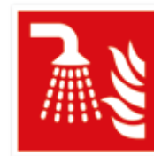
Feuerlöschsystem mit Wassernebel