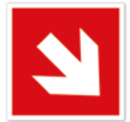
Richtungspfeil abwärts, aufwärts