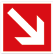
Richtungspfeil schräg, diagonal