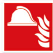
Mittel und Geräte zur Brandbekämpfung