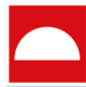
Mittel und Geräte zur Brandbekämpfung