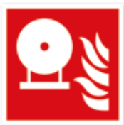
Unbeweglicher Feuerlöscher Feuerlöschflasche