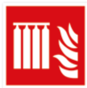
Unbewegliches System von Feuerlöschern in Serie