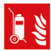
Feuerlöscher auf Rädern (fahrbar)