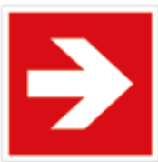
Richtungspfeil rechts, links