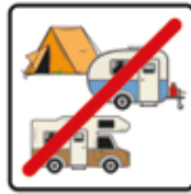
Zelten, Wohnwagen und Wohnmobile verboten