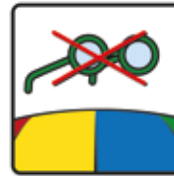
Brillen sind auszuziehen, verboten