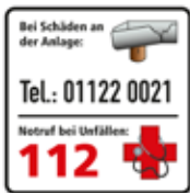
Bei Schäden an der Anlage Wasserspielplatz