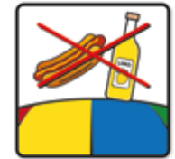
Das Essen und Trinken ist auf dem Kissen nicht gestattet