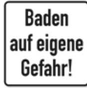
Baden auf eigene Gefahr