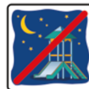
Spielen nach Einbruch der Dunkelheit verboten