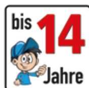
Altersfreigabe bis 14 Jahre