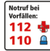
Notruf bei Vorfällen Rettungsdienst - Polizei