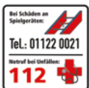
Bei Schäden an Spielgeräten, Notruf bei Unfällen – 112