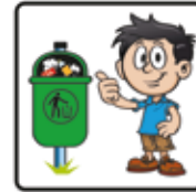
Abfälle gehören in den Mülleimer