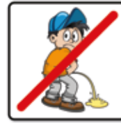
Urinieren ist verboten