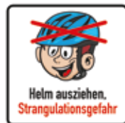
Fahrradhelm abnehmen, Strangulationsgefahr