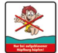
Nur bei aufgeblasenem Kissen hüpfen