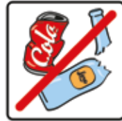
Keinen Müll auf den Boden werfen