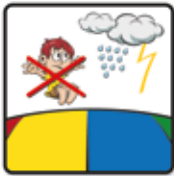
Bei Regen und Gewitter ist das Hüpfen nicht gestattet