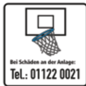
Bei Schäden an der Anlage Basketball