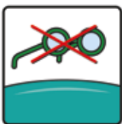
Brillen sind auszuziehen, verboten