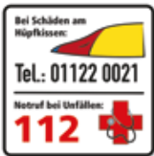
Kontaktdaten bei Schäden am Hüpfkissen, Notruf 112