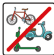
Fahrräder, Roller und E-Roller/Scooter verboten