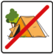
Zelten, Camping verboten