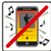
Laute Musik und Lärm verboten