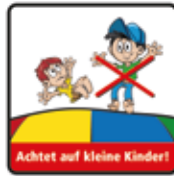
Beim Hüpfen auf kleine Kinder achten