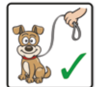
Hunde bitte anleinen