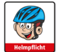
Bei Nutzung Helmpflicht