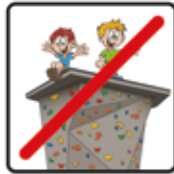
Auf das Dach klettern verboten