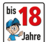
Altersfreigabe bis 18 Jahre