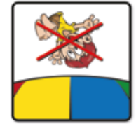
Salto oder Rückwärtsprünge sind nicht gestattet