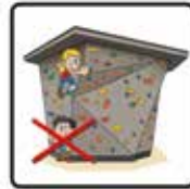
Aufenthalt unter Kletternden verboten