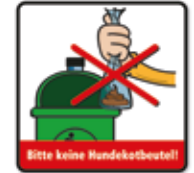
Bitte keine Hundekotbeutel einwerfen