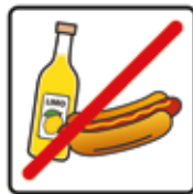
Das Essen und Trinken ist nicht gestattet