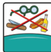
Spitze und andere Gegenstände sowie Essen und Trinken ist nicht gestattet