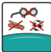
Spielzeug, Bälle, spitze und andere Gegenstände sind auf dem Kissen nicht gestattet