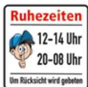
Ruhezeiten 12.00-14.00 Uhr, 20.00-08.00 Uhr