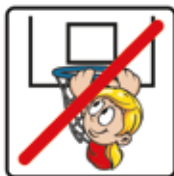
An den Basketballkorb hängen verboten