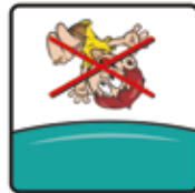
Salto oder Rückwärtsprünge sind nicht gestattet