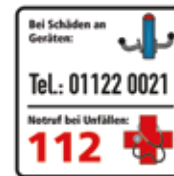
Bei Schäden an Geräten Fitness