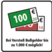
Bei Verstoß Bußgelder bis 1.000 € möglich