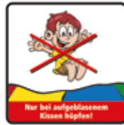
Nur bei aufgeblasenem Kissen hüpfen