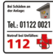
Bei Schäden an der Anlage Kletterblock