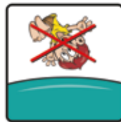
Salto oder Rückwärtsprünge sind nicht gestattet