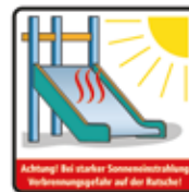
Verbrennungsgefahr auf der Rutsche