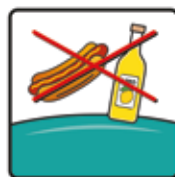
Das Essen und Trinken ist auf dem Kissen nicht gestattet