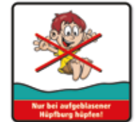
Nur bei aufgeblasenem Kissen hüpfen