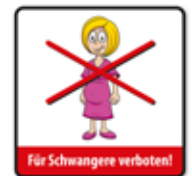
Für Schwangere verboten