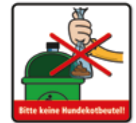
Bitte keine Hundekotbeutel einwerfen