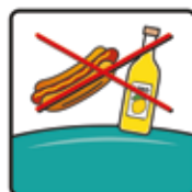
Das Essen und Trinken ist auf dem Kissen nicht gestattet