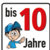
Altersfreigabe bis 10 Jahre