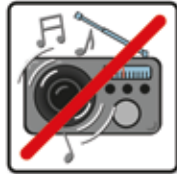
Laute Musik und Lärm verboten