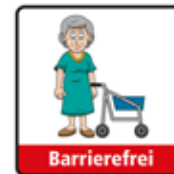
Barrierefrei Alte Frau mit Rollator