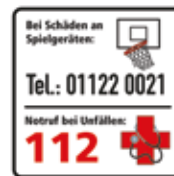
Bei Schäden an Spielgeräten Basketball