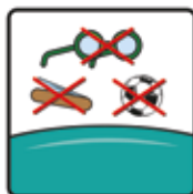
Spielzeug, Bälle, spitze und andere Gegenstände sind auf dem Kissen nicht gestattet