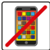
Smartphone / Handy verboten