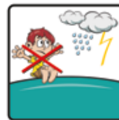
Bei Regen und Gewitter ist das Hüpfen nicht gestattet