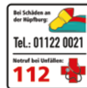
Kontaktdaten bei Schäden an der Hüpfburg, Notruf 112