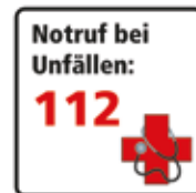
Notruf bei Unfällen: 112