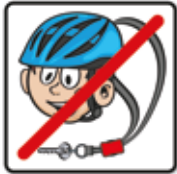
Helm und Schlüsselband vor dem Spielen abnehmen

Hier finden Sie aller momentan erhältlichen Piktogramme der Spielplatzschilderserie SP-01 mit den jeweiligen Namen und Kennnummern.