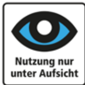
Nutzung nur unter Aufsicht