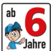
Altersfreigabe ab 6 Jahre