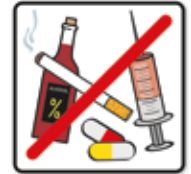
Alkohol- und Drogenkonsum sowie Rauchen verboten