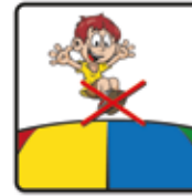
Nicht mit Schuhen hüpfen