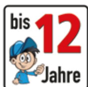
Altersfreigabe bis 12 Jahre