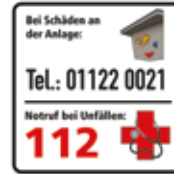
Bei Schäden an der Anlage Kletterblock