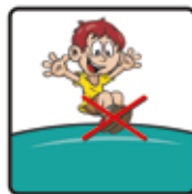
Nicht mit Schuhen hüpfen