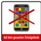
Smartphone / Handy auf dem gesamten Schulgelände verboten