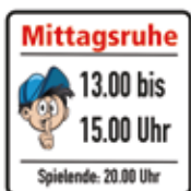
Mittagsruhe 13.00-15.00 Uhr, Spielende 20.00 Uhr