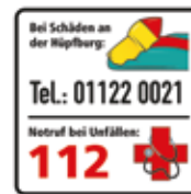
Kontaktdaten bei Schäden an der Hüpfburg, Notruf 112