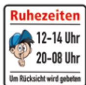
Ruhezeiten 12.00-14.00 Uhr, 20.00-08.00 Uhr Um Rücksicht wird gebeten