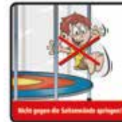
Nicht gegen die Seitenwände springen