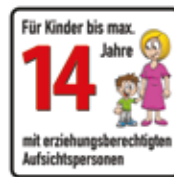
Für Kinder bis max. 14 Jahre mit erziehungsberechtigten Aufsichtspersonen