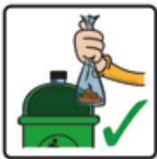
Hundekotbeutel im Mülleimer entsorgen