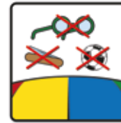
Spielzeug, Bälle, spitze und andere Gegenstände sind auf dem Kissen nicht gestattet