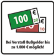
Bei Verstoß Bußgelder bis 1.000 € möglich