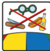
Spitze und andere Gegenstände sowie Essen und Trinken ist nicht gestattet