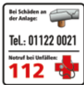
Bei Schäden an der Anlage Wasserspielplatz