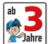
Altersfreigabe ab 3 Jahre