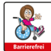
Barrierefrei Kind im Rollstuhl