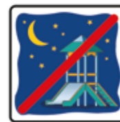
Spielen nach Einbruch der Dunkelheit verboten