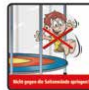
Nicht gegen die Seitenwände springen