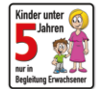
Kinder unter 5 Jahren nur in Begleitung Erwachsener