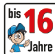
Altersfreigabe bis 16 Jahre