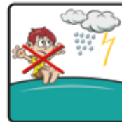
Bei Regen und Gewitter ist das Hüpfen nicht gestattet