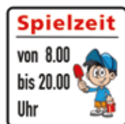
Spielzeit 08.00-20.00 Uhr