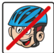
Fahradhelm vor dem Spielen abnehmen