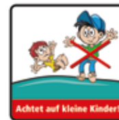
Beim Hüpfen auf kleine Kinder achten