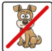
Für Hunde verboten