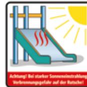
Verbrennungsgefahr auf der Rutsche