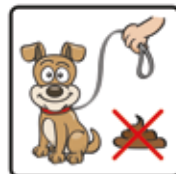
Das Mitführen von Hunden ist gestattet, Koten verboten