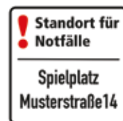
Standort für Notfälle