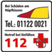
Kontaktdaten bei Schäden am Hüpfkissen, Notruf 112