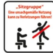
Unsachgemäße Nutzung Sitzgruppe