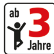
Altersfreigabe ab 3 Jahre