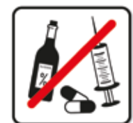
Alkohol und Drogen verboten