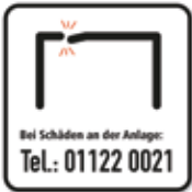
Bei Schäden an der Anlage (Calisthenics)