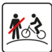
Verbot für Personen auf der Strecke Bikepark