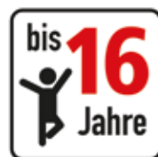
Altersfreigabe bis 16 Jahre