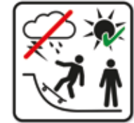
Anlage nur bei Tageslicht, trockenen Verhältnissen und bei Anwesenheit von mindestens einer zweiten Person erlaubt - Skateboard