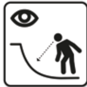
Vor der Nutzung, die Anlage auf Beschädigungen überprüfen