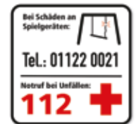
Bei Schäden an Spielgeräten, Notruf bei Unfällen - 112