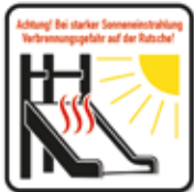
Sonneneinstrahlung Rutsche Verletzungsgefahr