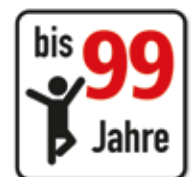
Altersfreigabe bis 99 Jahre