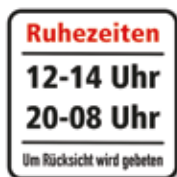
Ruhezeiten 12.00-14.00 Uhr, 20.00-08.00 Uhr Um Rücksicht wird gebeten