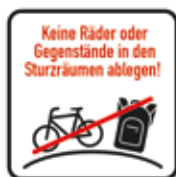
Keine Räder oder Gegenstände in den Sturzräumen ablegen Bikepark