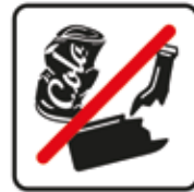
Keinen Müll auf den Boden werfen