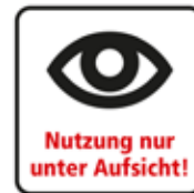
Nutzung nur unter Aufsicht