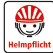
Es gilt die Helmpflicht