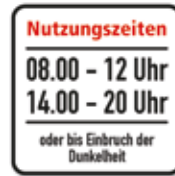
Nutzungszeiten 8-12 Uhr 14-20 Uhr