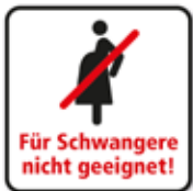
Für Schwangere nicht geeignet