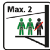
Podest max. 2 Personen Seilpark