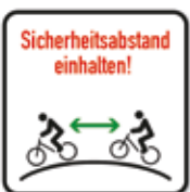
Sicherheitsabstand einhalten Bikepark