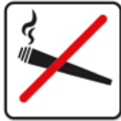
Konsum von Cannabis verboten