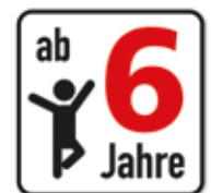
Altersfreigabe ab 6 Jahre