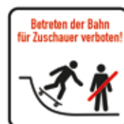
Betreten der Bahn für Zuschauer verboten Skatepark