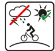
Bei Gewitter, Regen Nutzung verboten Bikepark