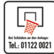
Bei Schäden an der Anlage (Basketball)