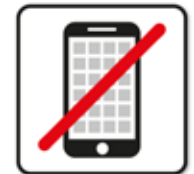
Smartphone / Handy verboten