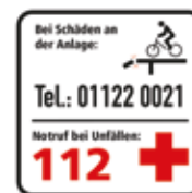
Bei Schäden an der Anlage Notrufnummer Bikepark