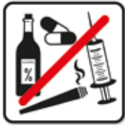
Alkohol und Drogen, Cannabis verboten