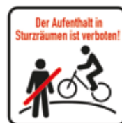
Der Aufenthalt in den Sturzräumen ist verboten Bikepark