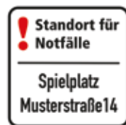
Standort für Notfälle Spielplatz Musterstraße 14