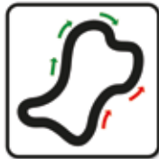
Die Strecke ist nur in einer Richtung zu befahren