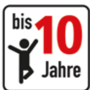
Altersfreigabe bis 10 Jahre