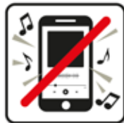
Laute Musik und Lärm verboten