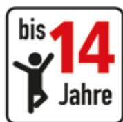
Altersfreigabe bis 14 Jahre