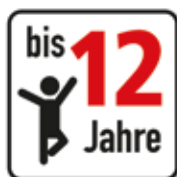
Altersfreigabe bis 12 Jahre