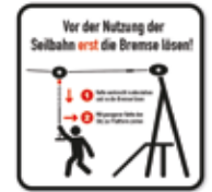
Vor Nutzung Bremse lösen Seilbahn