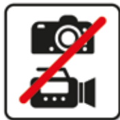
Fotografieren und Filmen verboten