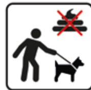
Das Mitführen von Hunden ist gestattet, Koten verboten