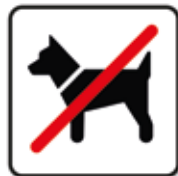
Für Hunde verboten