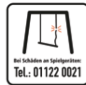
Bei Schäden an Spielgeräten, Tel.-Nr. des Wartungspersonals