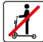
Für E-Roller verboten