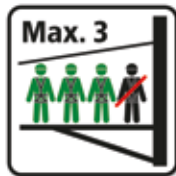
Podest max. 3 Personen Seilpark