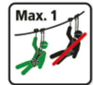
Seilfahrt nur 1 Person Seilpark