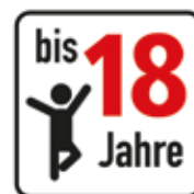
Altersfreigabe bis 18 Jahre