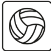
Volleyball spielen gestattet