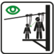
Sicherheitsausrüstung bei Kindern überprüfen Seilpark