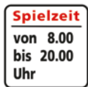
Spielzeit 08.00-20.00 Uhr