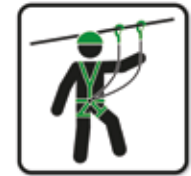
Sicherheitsausrüstung tragen Karabiner Seilpark