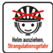
Helm vor dem Spielen abnehmen Strangulationsgefahr