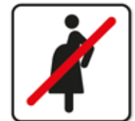
Für Schwangere verboten