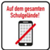
Smartphone / Handy auf dem gesamten Schulgelände verboten