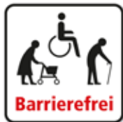
Barrierefrei Rollstuhl - ältere Menschen