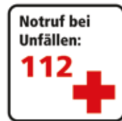
Notruf bei Unfällen 112