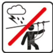
Kletterverbot bei Gewitter Seilpark