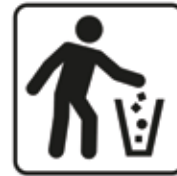
Abfälle gehören in den Mülleimer