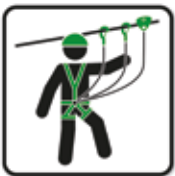
Sicherheitsausrüstung tragen Karabiner Seilrolle Seilpark