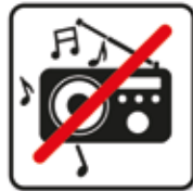
Laute Musik und Lärm verboten