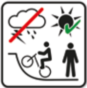
Anlage nur bei Tageslicht, trockenen Verhältnissen und bei Anwesenheit von mindestens einer zweiten Person erlaubt - BMX