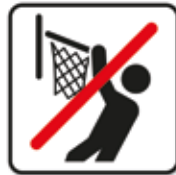
An den Basketballkorb hängen verboten