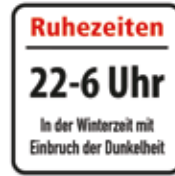
Ruhezeiten 22-6 Uhr