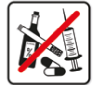
Alkohol- und Drogenkonsum sowie Rauchen verboten