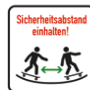
Sicherheitsabstand einhalten Skatepark