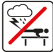
Bei Gewitter und Regen ist die Nutzung der Calisthenics-Anlage untersagt