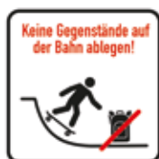
Keine Gegenstände auf der Bahn ablegen Skatepark