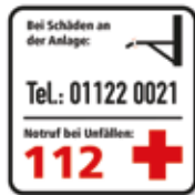
Bei Schäden an der Anlage Notrufnummer Seilpark