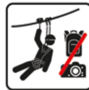
Rucksäcke, Kameras und lose Gegenstände verboten Seilpark