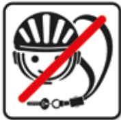
Helm und Schlüsselband vor dem Spielen abnehmen

Hier finden Sie aller momentan erhältlichen Piktogramme der Spielplatzschilderserie SP-02 und SP-05 (ohne schwarzen Rahmen) mit den jeweiligen Namen und Kennnummern.