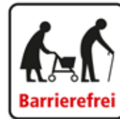
Barrierefrei Ältere Menschen