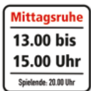
Mittagsruhe 13.00-15.00 Uhr, Spielende 20.00 Uhr