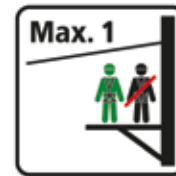
Podest max. 1 Person Seilpark