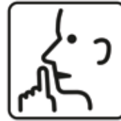
Rücksicht nehmen Leise sein