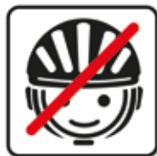
Helm vor dem Spielen abnehmen