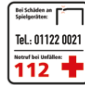
Bei Schäden an Spielgeräten Notrufnummer